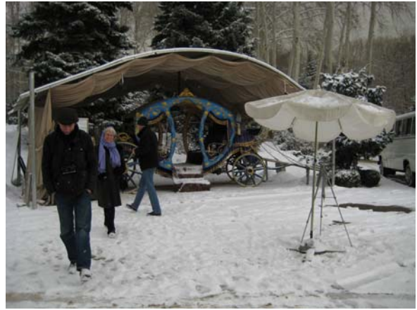
Figuur 5 Tuin Paleis van Sjah Reza.