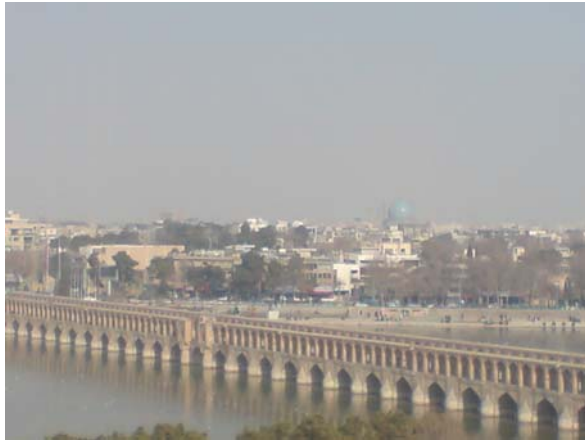
Figuur 6 Uitzicht vanuit mijn hotel op 17e eeuwse “30 bogen brug”.

Iran is een heel oud land (Perzië!) en er is daarom erg veel te zien. Na mijn werk heb ik dan ook met mijn vrouw en dochter en diens vriend een tour door Iran gemaakt. Beroemd is natuurlijk de ruïnes van Persepolis, een paleizencomplex uit 500 v Chr, gebouwd door Darius I en verwoest door Alexander de Grote. Restanten van een tentencomplex, gebouwd voor een feest van de Sjah – en waar Juliana en Bernard ook waren – zijn er nog te zien. Verder talloze oude graven van oude Perzische koningen, ver voor onze jaartelling. Ook bezochten we het voormalige paleis van de Sjah in Teheran, waar een dik pak sneeuw lag.