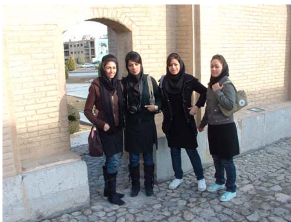
Figuur 4 Flanerende dames op de “30 bogen brug”.

Het komt vaak voor, dat bij bepaalde instellingen het hele walstuig in zijn eigenfrequentie komt en vreselijk begint te schudden. En dat resulteert in een diktevariatie van wel 20%. Met een formule voor de frequentie van de wals als oscillerende veer kan uitgerekend worden dat de frequentie rond de 160 Hz zou kunnen zijn. Waargenomen is 150 Hz. Door het veranderen van snelheid, in- en uittree trek of walsruwheid kan dit voorkomen worden.