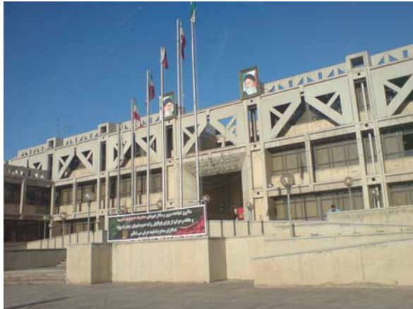
Figuur 1 Hoofdkantoor Staalbedrijf.

Toen ik eind 2007 door PUM benaderd werd voor een adviesklus in Iran, moest ik toch even op mijn hoofd krabben. Was dat niet een eng land? Niks eng, zei mijn Sector coördinator, er zijn dit jaar al 21 experts geweest en die kwamen allemaal enthousiast terug! PUM is een organisatie die Senior Experts uitzendt naar ontwikkelingslanden om daar te adviseren/helpen met ontwikkeling van van alles. De meeste experts zijn gepensioneerd, want je moet vrije tijd hebben en er wordt niet voor betaald, behalve onkosten. Er zijn ongeveer 4000 experts ingeschreven en ongeveer 2000 projecten per jaar. De experts zijn er op allerlei vakgebieden, maar voornamelijk MKB, zoals mensen uit de bakkerijwereld, land- en tuinbouw, onderwijs,