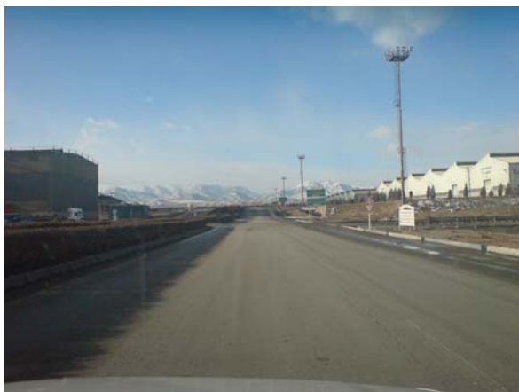
Figuur 2 Toegangsweg naar Staalbedrijf.

kleine industrie, enz. Behalve experts zijn ook de sectorcoördinatoren en landencoördinatoren vrijwilligers. Daarnaast zijn een aantal projectbegeleid(st)ers in vaste dienst. PUM valt onder NVO/NCW, maar de reis wordt betaald door een onzer ministeries, afhankelijk van het onderwerp.